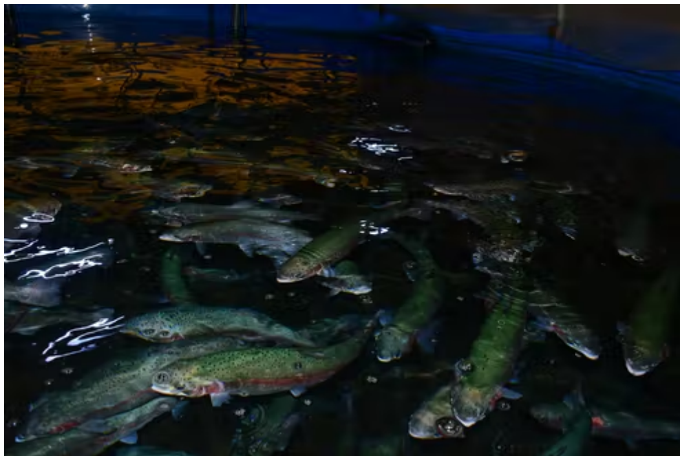
静岡市の「三保サーモン」はふるさと納税の返礼品にもなっている

東海4県では静岡、三重、愛知の3県で2015～20年の5年間に、少しずつ海面漁業に占める養殖業の割合（養殖率）が高まっている。静岡や愛知ではウナギ、三重ではブリやハマチなどの養殖が盛ん。最近では高級魚のヒラメやかす漬けなどになるサーモンも生産され、最新技術も導入されるようになった。内陸の岐阜県でもトラフグが養殖されている。