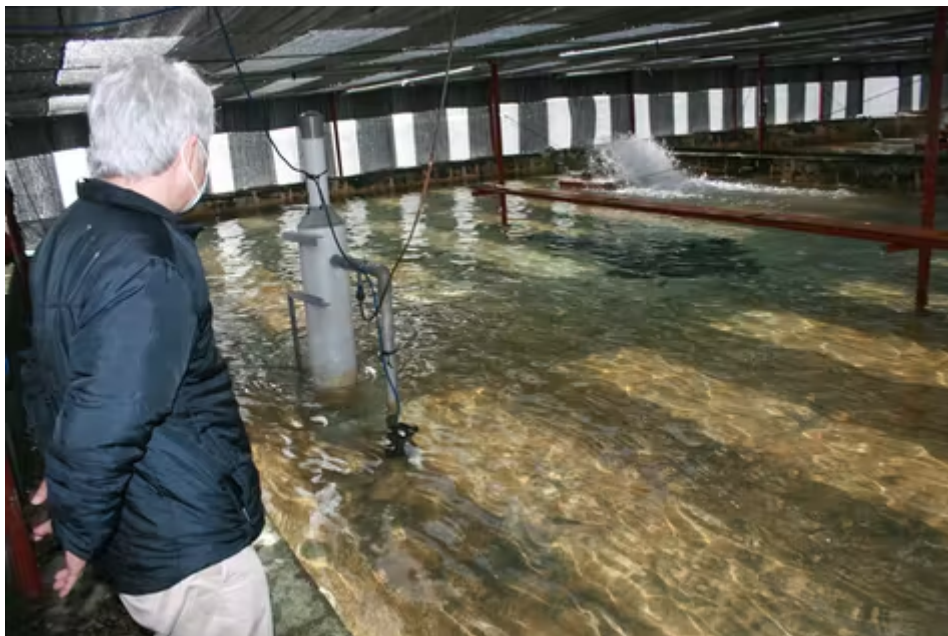
丸年水産はヒラメの陸上養殖を拡大する（三重県大紀町）

東海4県で最も養殖率を高めたのは静岡県で15～20年に1.8ポイント増えた。増減率順位は全国20位だった。三重県が1.6ポイント増（22位）、愛知県が0.1ポイント増（28位）で続いた。